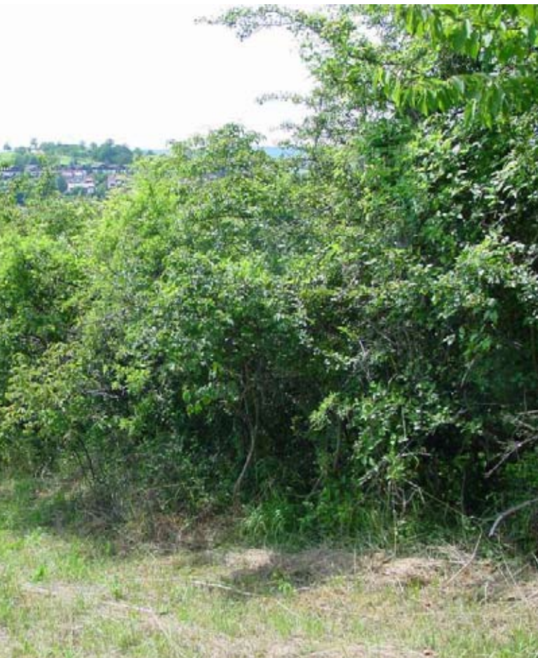
Abb. 35: Wildobsthecke als Wiesenbegrenzung.