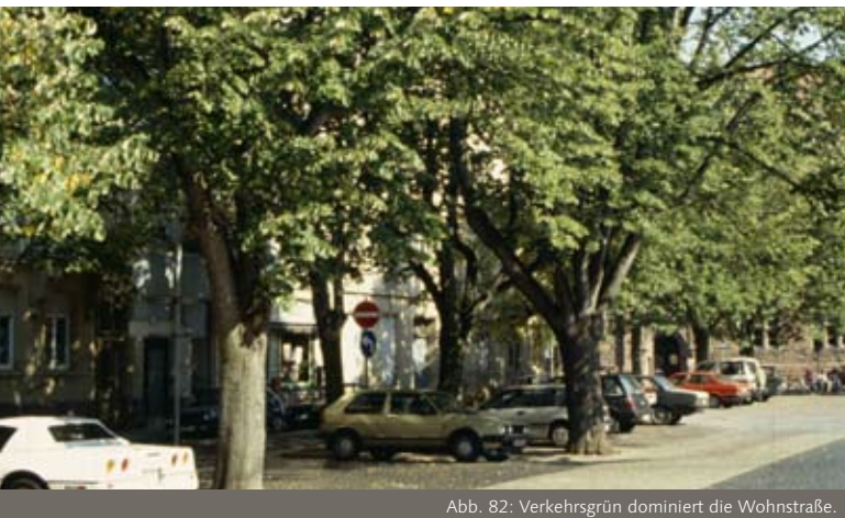
Abb. 82: Verkehrsgrün dominiert die Wohnstraße.