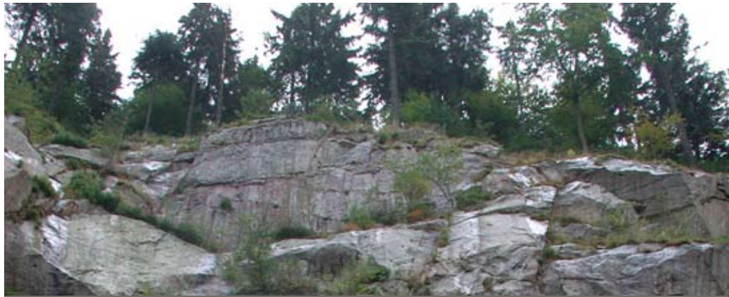
Abb. 71: Alte Steinbruchsteilwand.