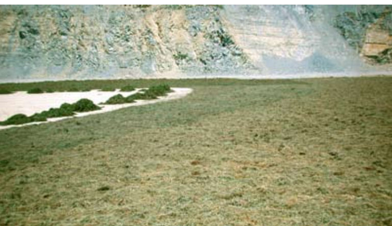
Abb. 86: Großfläche in einem Steinbruch.