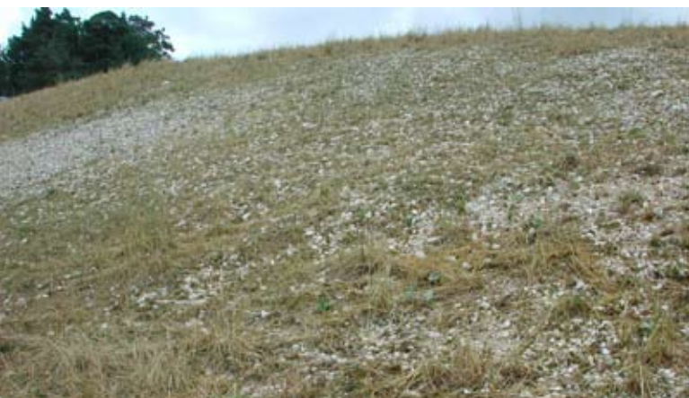
Abb. 42: Mageres Grasland in Kuppenlage (Georgien).