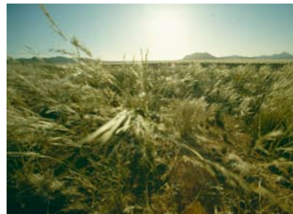
Abb. 39: Grasland in Trockengebieten.