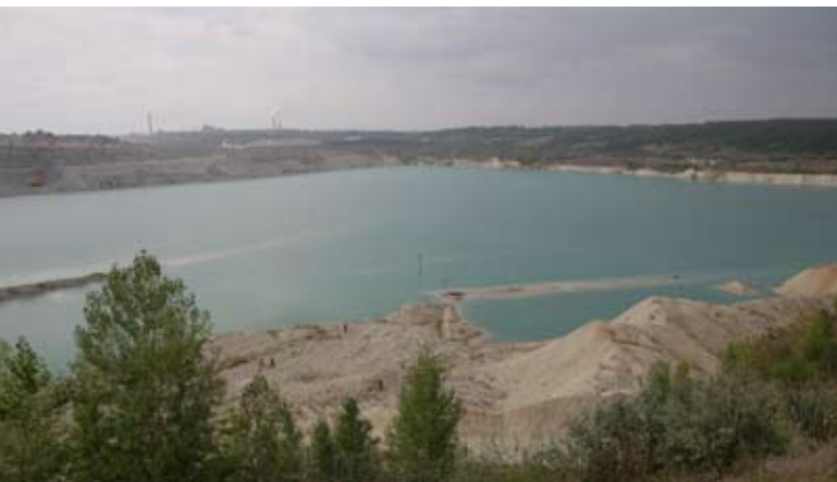
Abb. 58: Großes Gewässer im laufenden Abbaubetrieb.