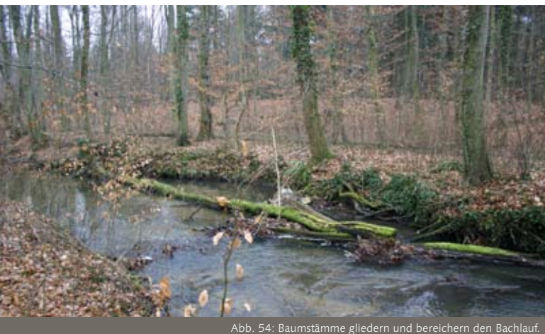
Abb. 54: Baumstämme gliedern und bereichern den Bachlauf.