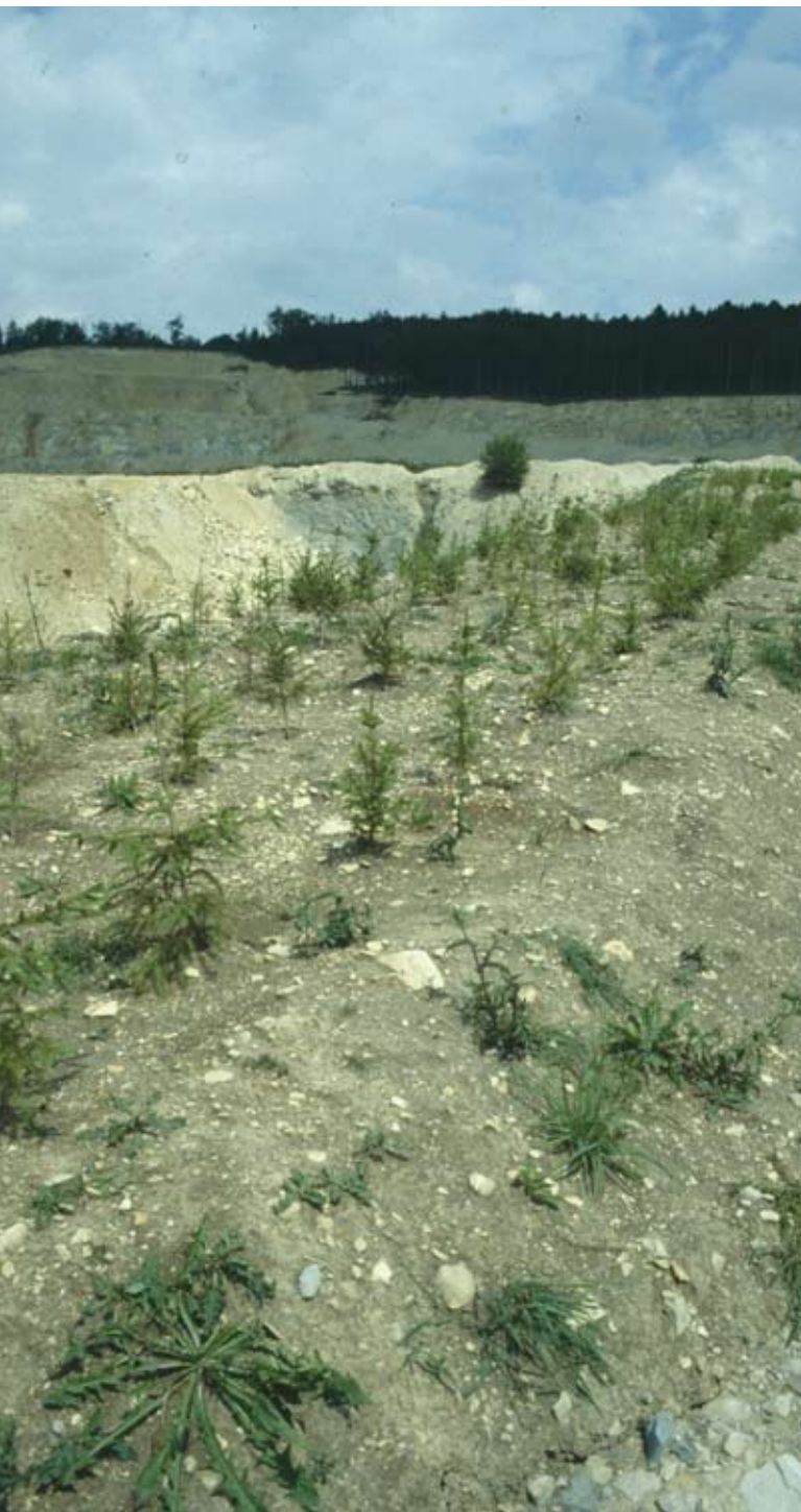
Abb. 27: Mindestanforderung für Baumpflanzungen sind nicht erreicht.