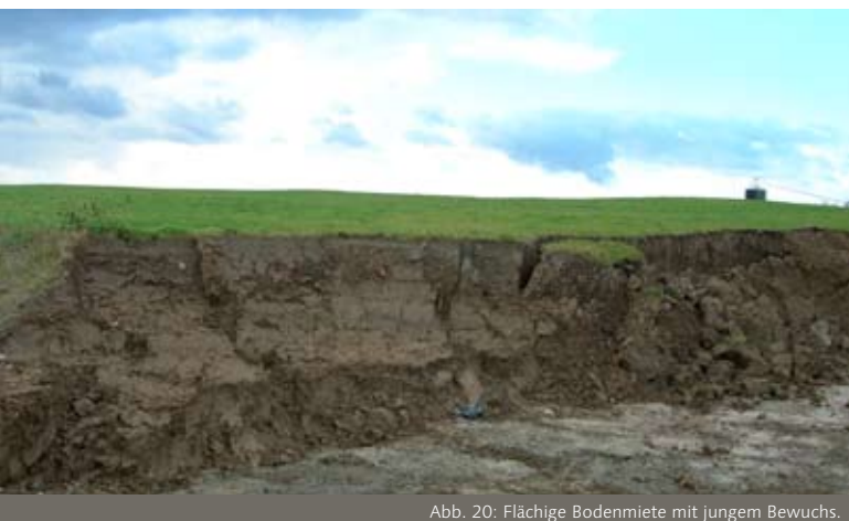
Abb. 20: Flächige Bodenmiete mit jungem Bewuchs.

Ober- und Unterboden berechnet werden. Diese Mengen sind zwischen zu lagern.