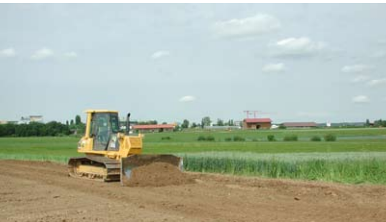
Abb. 23: Moorraupe bei der Rekultivierung von Lössäckern.

lassen. Begrünter Boden zeigt geringe Erosionserscheinungen sowohl gegen Wind- als auch Wassererosion. Durch die Besiedlung mit Wildarten sind Oberbodenmieten und Unterbodenhalden als Wanderbiotope einstuftbar (Abb. 22).