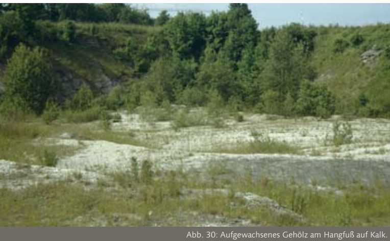
Abb. 30: Aufgewachsenes Gehölz am Hangfuß auf Kalk.