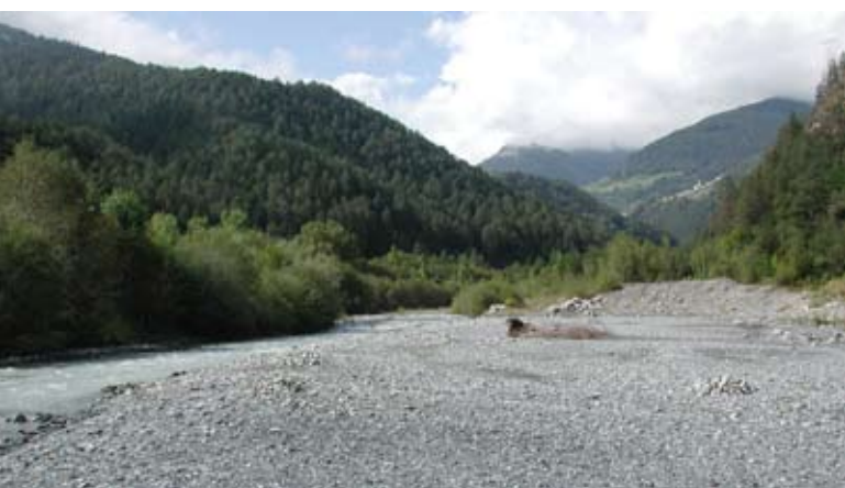
Abb. 53: Dynamische Gebirgsflüsse ändern ihr Aussehen ständig.