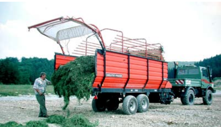
Abb. 85: Ausbringung des Mähguts.