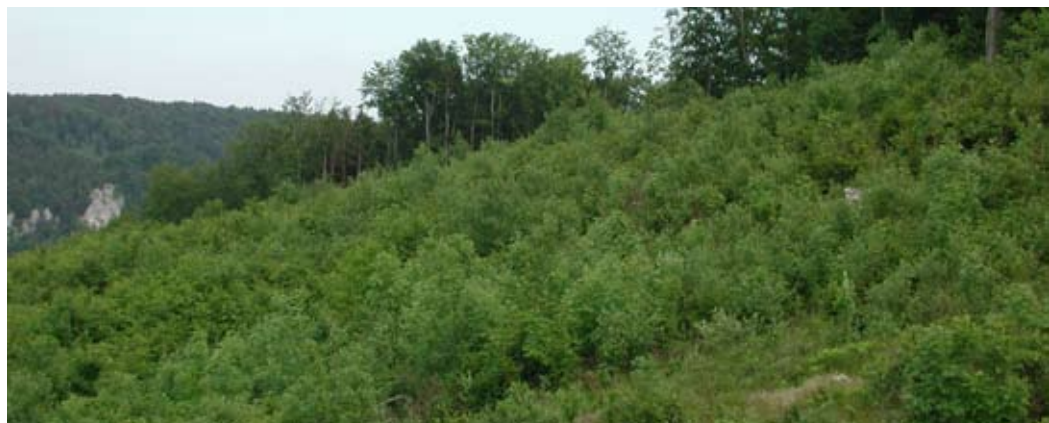
Abb. 26: Buchensukzession auf Kahlschlagfläche.