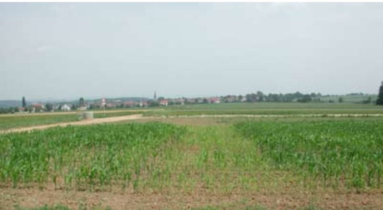
Abb. 21: Ernteeinbußen durch wenige Fahrten mit Lastwagen auf der Bodenmiete. Der darunter liegende Boden wurde verdichtet.