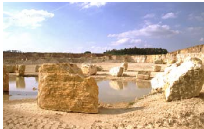
Abb. 69: Schutz vor Befahren und Zerstörung durch Steine oder Wallschüttung.