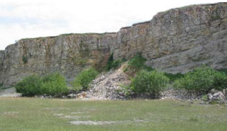
Abb. 77: Schütter bewachsene Abbausohlen und Schuttkegel mit Weidegehölzen.