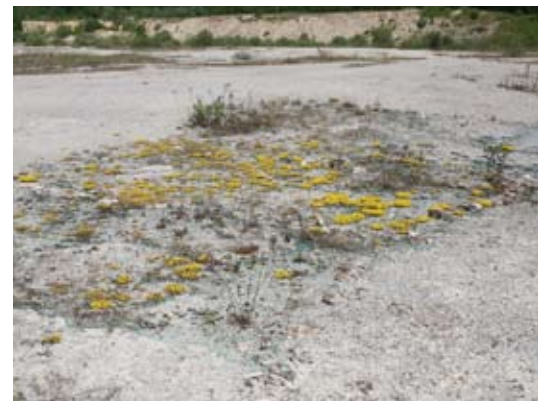
Abb. 79: Ansaatversuche auf Rohboden – Pflanzenarten der Felsen konnten sich durchsetzen.