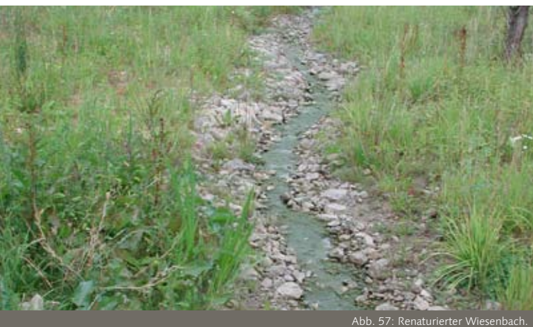
Abb. 57: Renaturierter Wiesenbach.