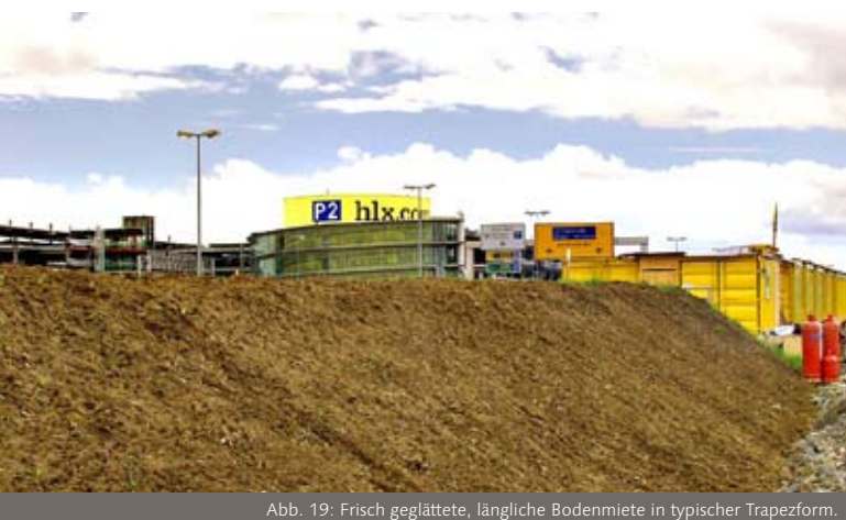
Abb. 19: Frisch geglättete, längliche Bodenmiete in typischer Trapezform.