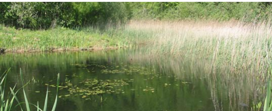
Abb. 62: Temporäres Gewässer mit Röhrichtaufwuchs.

Grundsätzlich sind bei den Kleingewässern die ausdauernden Gewässer von den temporären Gewässern zu unterscheiden. Die ausdauernden Kleingewässer weisen eine permanente Wasserführung auf. Die temporären Kleingewässer sind dagegen durch eine mehr oder weniger lange Trockenperiode charakterisiert. Entsprechend dieser Bedingungen existiert in den Kleingewässern eine spezialisierte Tier-