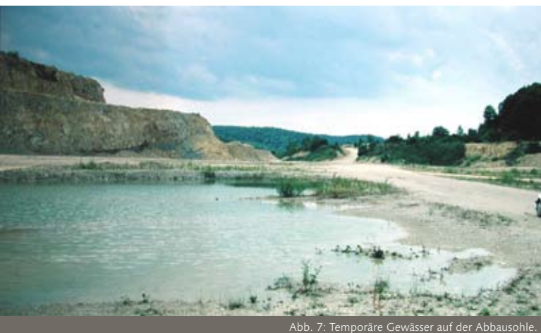
Abb. 7: Temporäre Gewässer auf der Abbausohle.