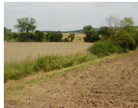
Abb. 49: Rain als Strukturelement.

Die schädlichen Auswirkungen auf Boden, Wasser, Luft und Artenvielfalt sowie die Gesundheit des Menschen werden bei dieser Bewirtschaftungsform minimiert. Nachhaltige Landwirtschaft wirkt daher ökologisch und ökonomisch positiv, sozial verantwortlich und dient als Basis für zukünftige Generationen.