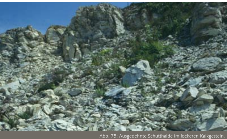
Abb. 75: Ausgedehnte Schutthalde im lockeren Kalkgestein.

räume sind in der Landschaft heute selten geworden und prägen damit den naturschutzfachlichen Wert einer Abbaustätte. Entscheidend ist hierbei das Vorhandensein wenig bewachsener Offenstandorte. So stellen Steilwände aus Lockergestein wichtige Bruthabitate für Höhlen bauende Vogelarten oder Wildbienen dar (Abb. 74). Felswände bieten dagegen auf Absätzen und in Nischen Nistmöglichkeiten für felsbrütende Vogelarten. Auf Felsköpfen und Schutthalden sind häufig seltene und gefährdete Pflanzenarten zu finden. Offene Rohböden stellen für zahlreiche Arten u.a. der Vögel, Reptilien, Heuschrecken, Laufkäfer, Spinnen und Hautflügler lebensnotwendige Habitate dar.