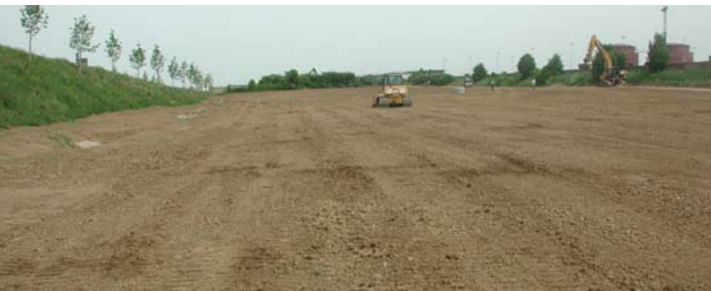
Abb. 50: Fertige Ackerrekultivierung auf Lössboden.

Die neuen Ackerflächen sollten direkt nach der Anlage mit Gründüngung angesät werden. Dies schützt den Boden und fördert die Bildung der gewünschten Bodenstruktur. Gleichzeitig werden unerwünschte Unkräuter unterdrückt. Feldfrüchte werden frühestens nach 2 Jahren angesät (Abb. 51). Für die Randstrukturen wie Raine und Hecken ist die Vorbereitung mit diesen Bodenbedingungen ebenfalls optimal. Die Flächen werden sofort angesät und in der besten Jahreszeit bepflanzt. Schmale Wiesen- und Brachestreifen sollten nach der Gründüngungszeit entweder als Wiesenfläche mit artenreichen heimischen Wiesen angesät oder mit frischem samenreichen Mähgut umgebender Wiesen belegt werden. Einsaat mit einer Feldfrüchtemischung ist ebenfalls nützlich.