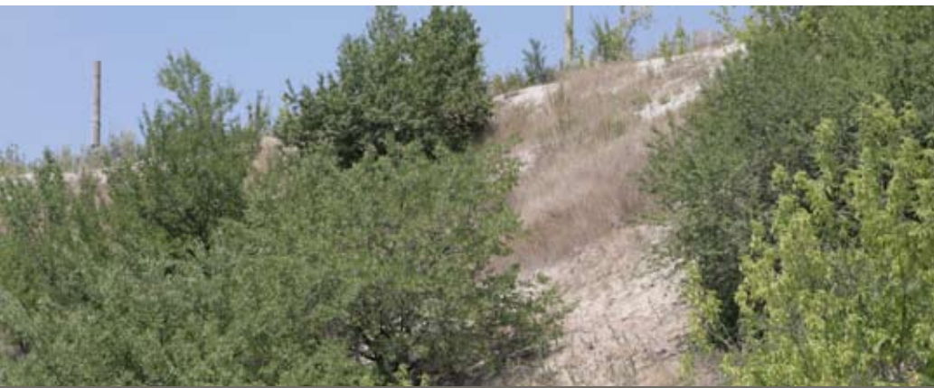
Abb. 37: Spontaner Gehölzaufwuchs am Hang. Solche Flächen können in die Detailplanung integriert werden.