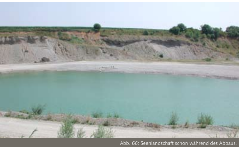
Abb. 66: Seenlandschaft schon während des Abbaus.