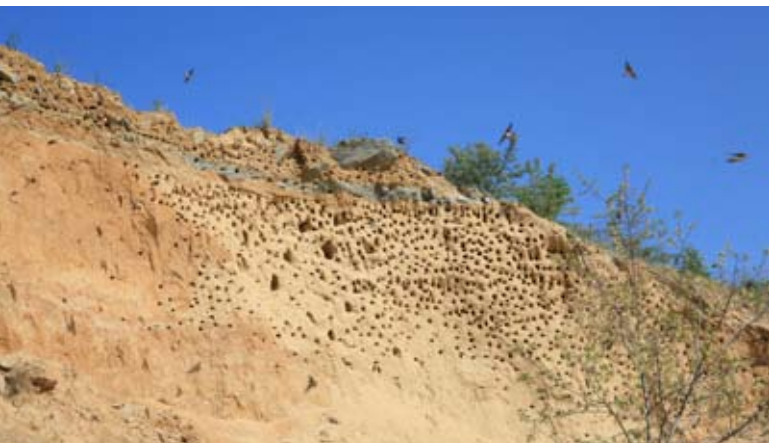
Abb. 2: Uferschwalbenkolonie in alten Flussablagerungen in einer Steilwand einer Abbaustätte.