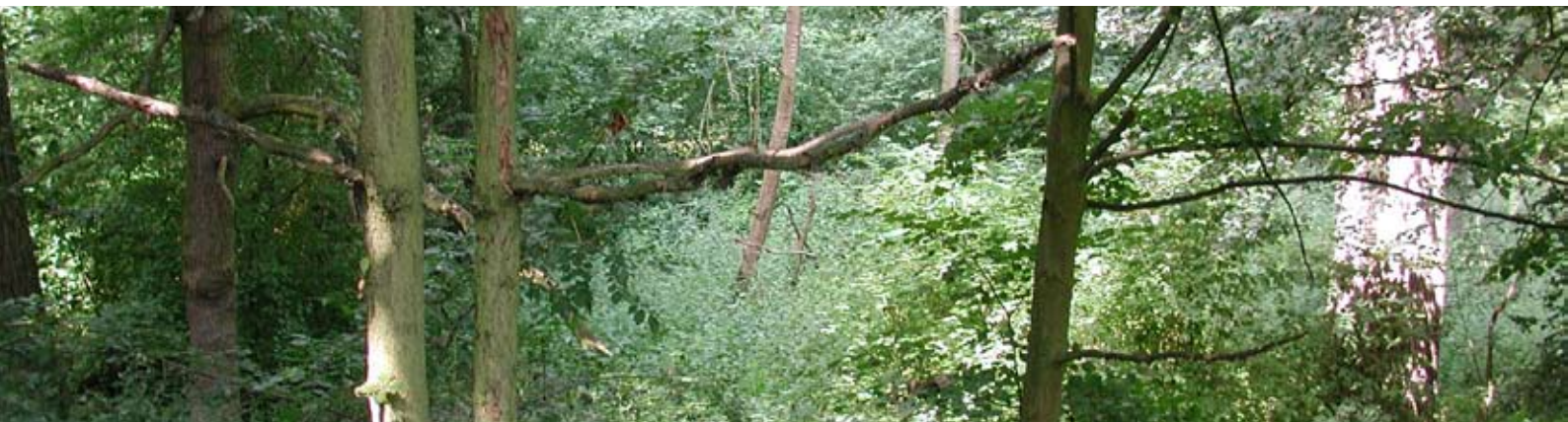
Abb. 34: Naturnaher lichter Auenwald.