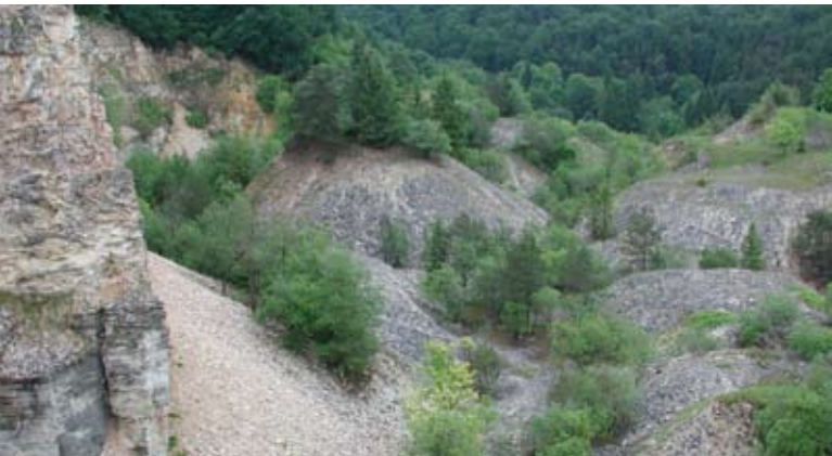
Abb. 76: Vegetationsmosaik auf ehemaligen Halden: Am Fuß der Halden herrschen Gehölze vor, auf der Kuppe Trockenheit ertragende Grasfluren.