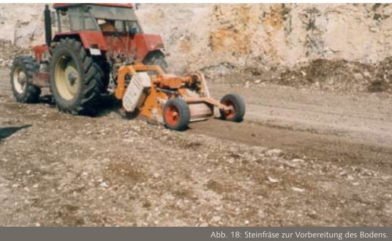
Abb. 18: Steinfräse zur Vorbereitung des Bodens.