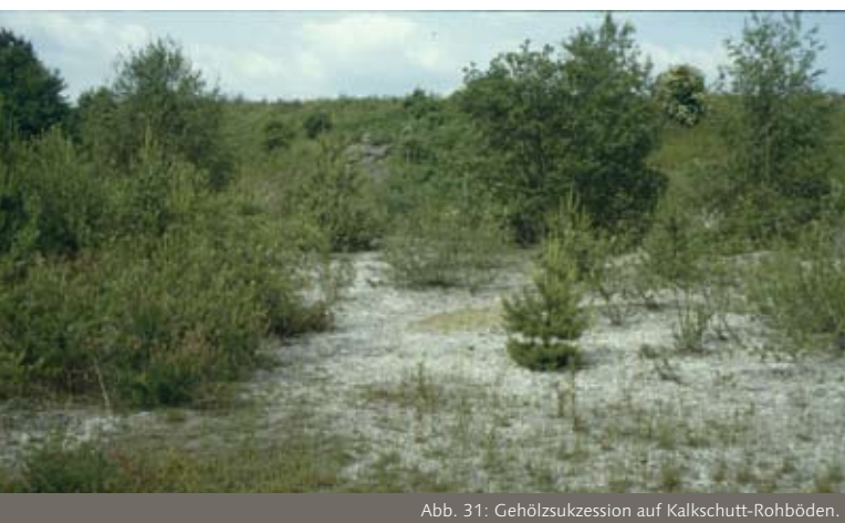
Abb. 31: Gehölzsukzession auf Kalkschutt-Rohböden.