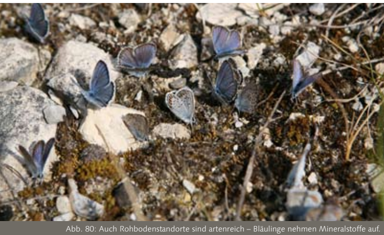
Abb. 80: Auch Rohbodenstandorte sind artenreich – Bläulinge nehmen Mineralstoffe auf.