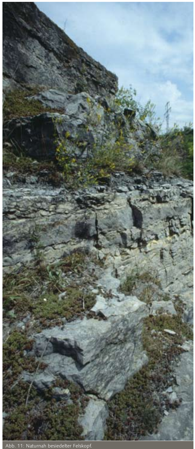
Abb. 11: Naturnah besiedelter Felskopf.