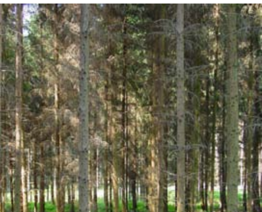
Abb. 25: Fichtenmonokultur nach Durchforstung.

Durch Ansaaten, Förderung heimischer Arten, Strukturreichtum, Schutz und Erhalt von einigen Altbäumen kann auch eine ökonomisch orien- tierte Waldbewirtschaftung die Biodiversität solcher Flächen erhöhen, ohne merkliche ökonomische Einbußen hinnehmen zu müssen. Der Holzein- schlag sollte mosaikartig auf vergleichsweise kleinen Flächen erfolgen, große Kahlschläge sind zu ver- meiden.