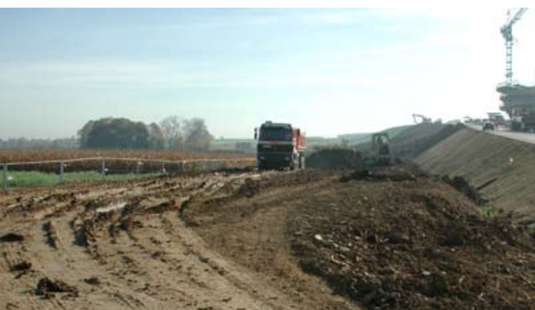
Abb. 16: Starke Verdichtung durch Befahren mit Radfahrzeugen.