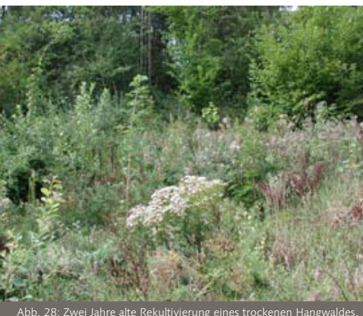
Abb. 28: Zwei Jahre alte Rekultivierung eines trockenen Hangwaldes.

Da eine forstliche Nutzung auch am Ertrag orientiert ist, wird die freie Sukzession in den wenigsten Fällen Grundlage für die Wiederherstellung forstlich genutzter Wälder sein. Die Steuerung der Wunschbaumarten ist hier nur sehr langfristig realisierbar. Aus forstwirtschaftlicher Sicht ist auch die Ansaat im Hinblick auf die Entwicklungsrichtung des späteren Wirtschaftswaldes wenig kalkulierbar. Dennoch kann die Ansaat auf Waldflächen in klimatisch ungünstigeren Gebieten eine wichtige und zielführende Methode sein, da so nur klimatisch optimal