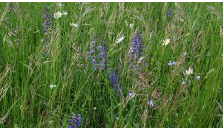
Abb. 46: Artenreiche Wirtschaftswiese vor dem ersten Schnitt.