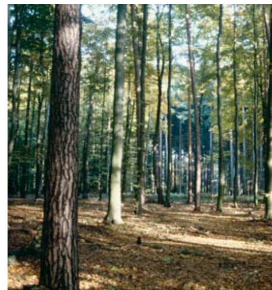
Abb. 24: Mischwald mit gleich alten Bäumen.

Der Wald soll so gegenwärtig und in Zukunft wichtige ökologische, wirtschaftliche und soziale Funktionen auf lokaler, nationaler und globaler Ebene erfüllen. Anderen Ökosystemen soll dabei kein Schaden zugefügt werden.