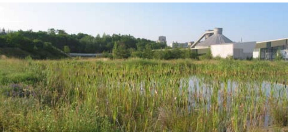
Abb. 64: Dauerhaftes Flachgewässer im renaturiertem Steinbruch.

Geeignete Flächen finden sich z. B. im Bereich der Abbau- und Zwischensohlen von Steinbrüchen, in