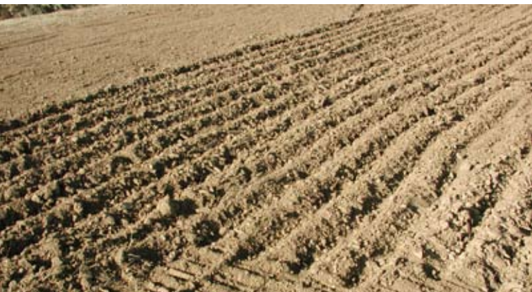
Abb. 15: Die Bodenfeuchte dieses Lössbodens ist optimal – der Oberboden liegt locker und verdichtet durch die Bearbeitung nicht.