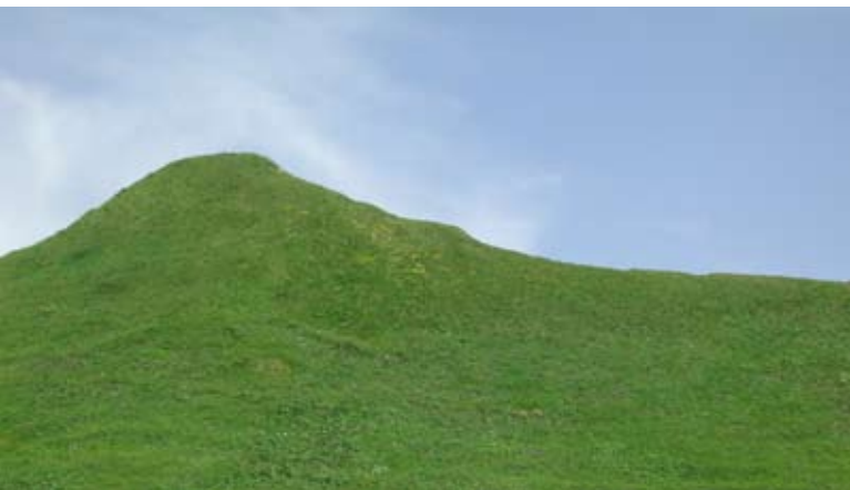
Abb. 40: Almwiese in den zentralen europäischen Alpen.