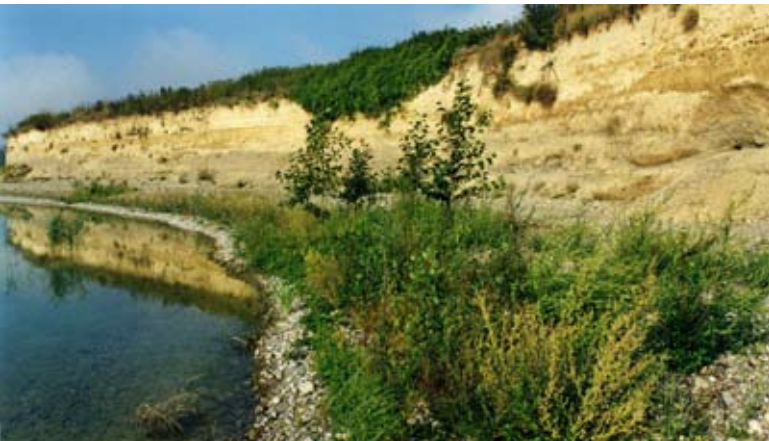
Abb. 74: Lockergesteinswände mit Kolonien von Uferschwalben (oben) und Bienenfressern (Mitte).