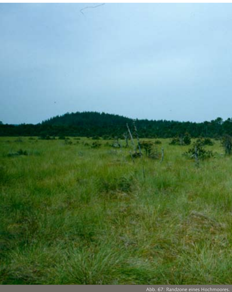
Abb. 67: Randzone eines Hochmoores.

Auskiesungsflächen von Kiesgruben und am Fuß und auf Verebnungen von Halden. Ein Zusammenhang mit dem Umfeld und dort vor allem mit anderen Stillgewässern ist von Vorteil, aber nicht unbedingt notwendig. Bestehende Gewässer können vergrößert werden (Abb. 66).