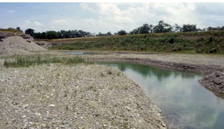
Abb. 4: Junges Gewässer als Lebensraum für spezialisierte Tiere und Pflanzen.

hierfür sind die extremen Umweltbedingungen in den Abbaustätten und die sehr hohe Standortvielfalt. Charakteristische abbaustättentypische Lebensräume sind z. B. die Abbauwände (Abb. 2), die dauerhaften Gewässer, die temporären Gewässer z. B. in Fahrspuren, die Schutt- und Abraumhalden (Abb. 3, Abb. 4).