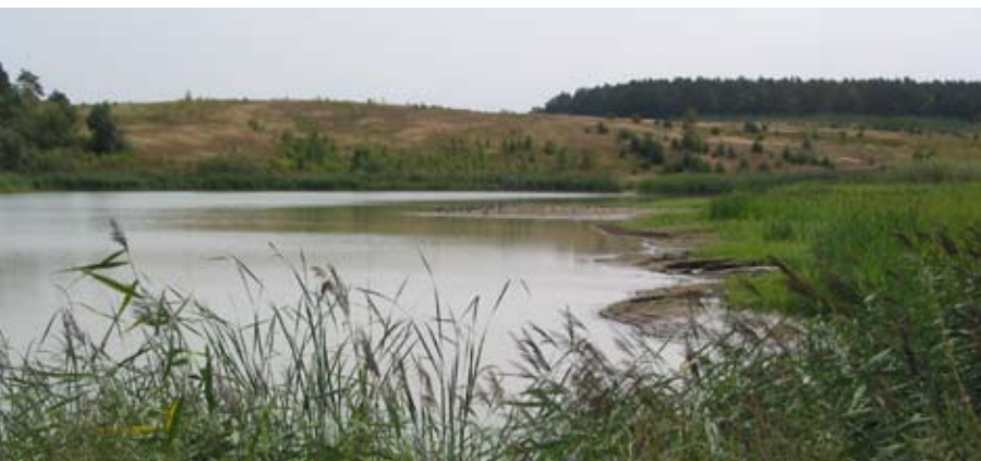
Abb. 68: Röhrichtbestände als Vegetationsmosaik.

Geeignete Geländeformen für Feuchtbiotope in Abbaustätten sind weitgehend ebene Flächen mit kleinen Vertiefungen. Diese Vertiefungen sind mit wasserundurchlässigem Material auszukleiden, so dass sich Wasser ansammeln kann. Feuchtbiotope entstehen automatisch am Rande der Still- und Fließgewässer.