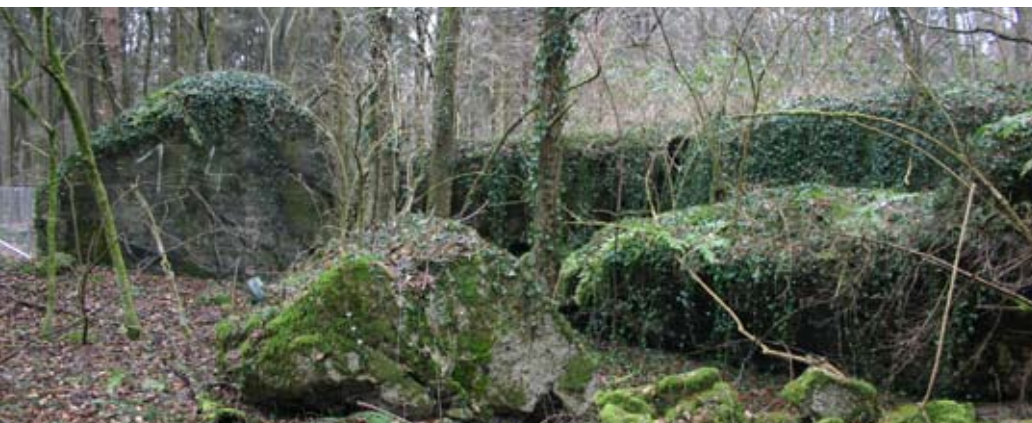
Abb. 33: Steinsetzungen zur Strukturerrhöhung in einem jungen Laubwald.

Nach Beendigung der Geländegestaltung wird der steinarme bis steinige Rohboden mit ausreichend Feinanteil, sofern gewünscht, belassen oder mit Oberboden bis 0,3 m Dicke überdeckt. Die Flächen sollten unmittelbar nach Anlage der Rohböden eingesät bzw. bepflanzt werden.