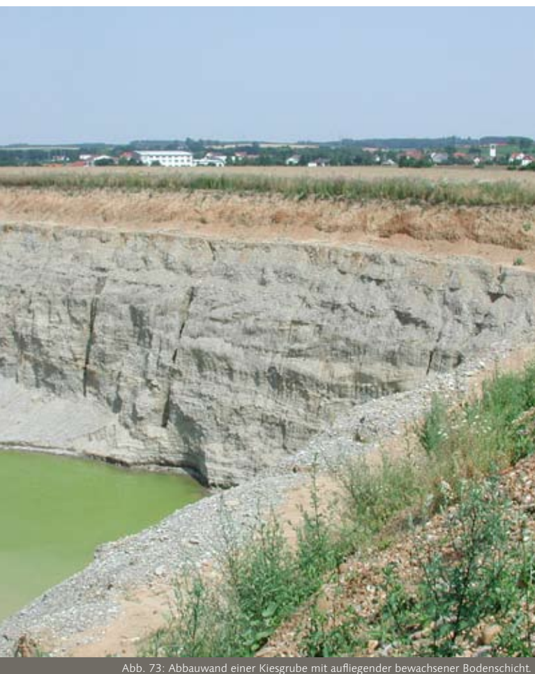
Abb. 73: Abbauwand einer Kiesgrube mit aufliegender bewachsener Bodenschicht.

Wasserverfügbarkeit ist in der Regel gering und die Temperaturschwankungen sind hoch. Wichtige Standortfaktoren sind zudem das Ausgangsgestein, die Exposition und das Alter seit der Entstehung. Felsbereiche lassen sich typischerweise in verschiedene Teilbiotopie wie Felswand, Felskopf und Schutthalde gliedern (Abb. 72). Diese Teilbiotopie weisen eine eigenständige Vegetation auf. Felsbereiche können sehr große Dimensionen von weit über 100 m Höhe erreichen.