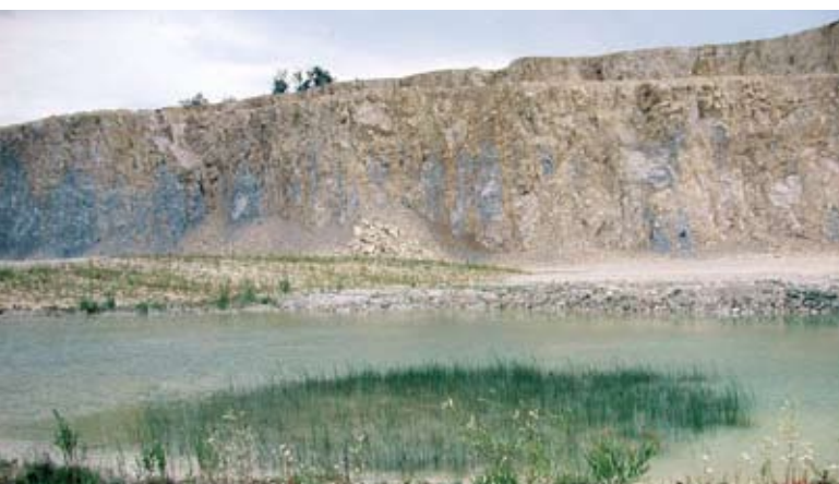
Abb. 3: Die Besiedlung der Flächen erfolgt vergleichsweise schnell.