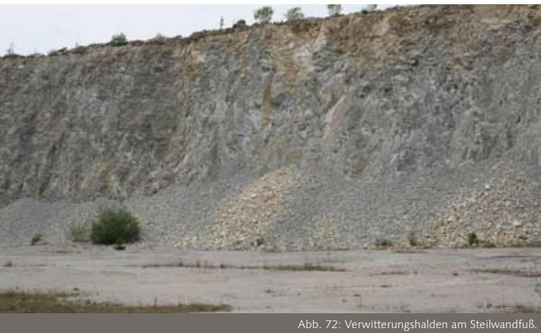
Abb. 72: Verwitterungshalden am Steilwandfuß.