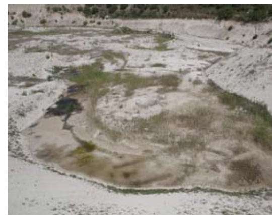
Abb. 1: Junge Vegetationsinitialen auf der Abbausohle.