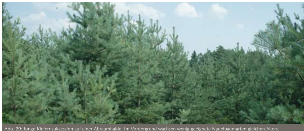
Abb. 29: Junge Kiefersukzession auf einer Abraumhalde. Im Vordergrund wachsen wenig geeignete Nadelbaumarten gleichen Alters.