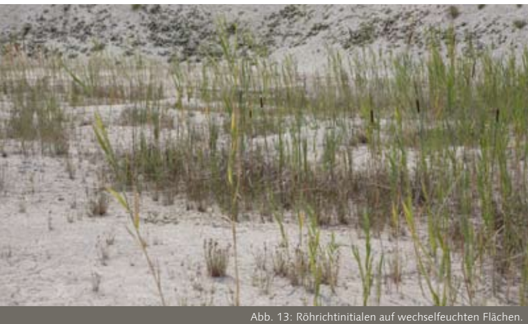
Abb. 13: Röhrchitinitialen auf wechselfeuchten Flächen.