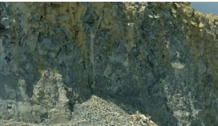
Abb. 78: Lebensraumverbund aus Steilwand, Halde und Sohle mit Rohböden.