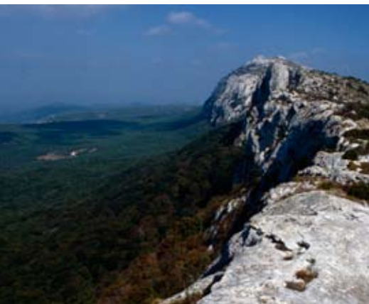
Abb. 70: Felsgrad am Mt. Ventoux mit Steilwänden.