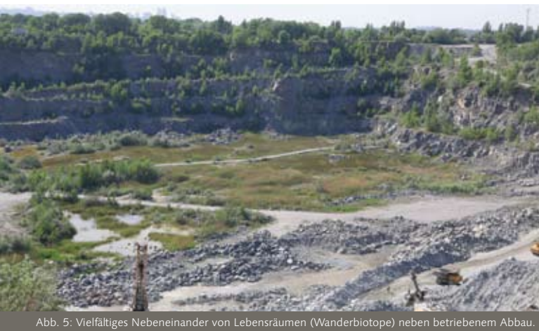
Abb. 5: Vielfältiges Nebeneinander von Lebensräumen (Wanderbiotope) neben betriebenem Abbau.