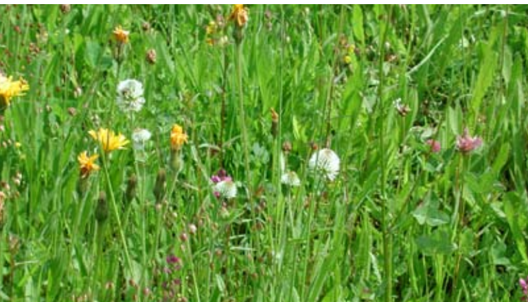
Abb. 47: Magere Wirtschaftswiese Mitteleuropas.

allem handelsübliches, aber artenreiches Saatgut möglichst mit heimischen Arten fachgerecht ausgebracht.