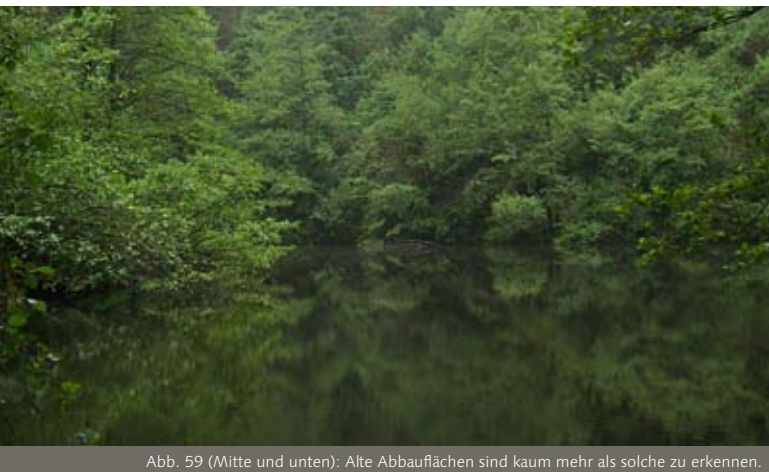
Abb. 59 (Mitte und unten): Alte Abbaufächen sind kaum mehr als solche zu erkennen.

stehen der Tier- und Pflanzenwelt drei Bereiche zur Verfügung: