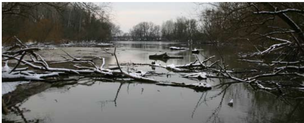
Abb. 61: Strukturreiche Flachwasserzone.