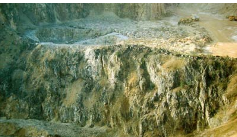
Abb. 6: Naturnahe Felswand.