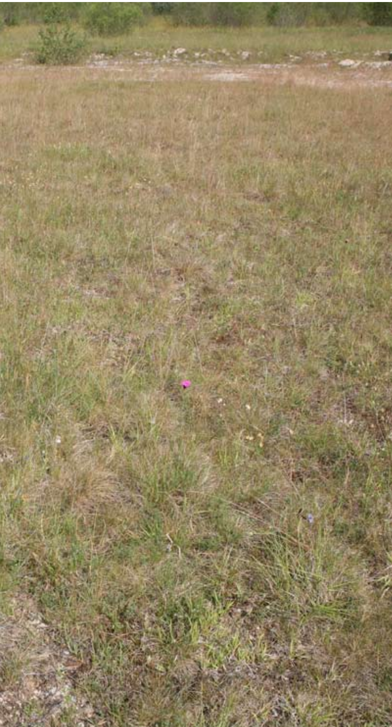
Abb. 88: Mähgutausbringungsfläche nach 4 Jahren Entwicklungszeit – alle Zielarten sind nachgewiesen.