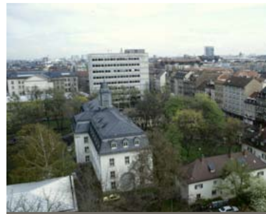
Abb. 84: Kleiner Park in Nachbarschaft zu dichter Bebauung.