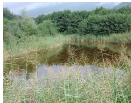
Abb. 63: Naturnah bewachsener ehemaliger Baggersee