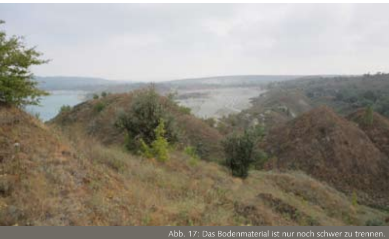
Abb. 17: Das Bodenmaterial ist nur noch schwer zu trennen.