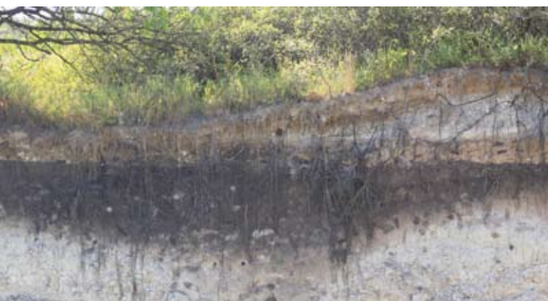
Abb. 41: Bioturbation in Schwarzerden (Ukraine). Helles und dunkles Bodenmaterial wurde durch Nagetiere verlagert. Dadurch entstehen auffällige Flecken.