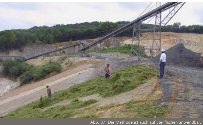
Abb. 87: Die Methode ist auch auf Steilflächen anwendbar.

den Tieren benötigten Strukturen und dem entsprechenden pflanzlichen Bewuchs. Die Verwendung von naturraumidentischen und damit autochthonem Pflanzenmaterial ist hierbei grundlegend wichtig. Die wichtigsten Methoden für eine erfolgreiche Renaturierung werden nachfolgend kurz mit ihren Vor- und Nachteilen erläutert. Als Methode mit den besten Erfolgen hat sich aufgrund langjähriger Erfahrungen die Mähgutausbringung erwiesen.