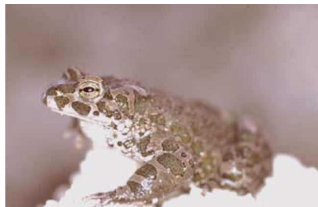
Abb. 65: Die Wechselkröte ist ein typischer Besiedler vegetationsfreier Kleingewässer.