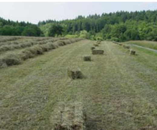
Abb. 43: Maschinelle Heuernte.