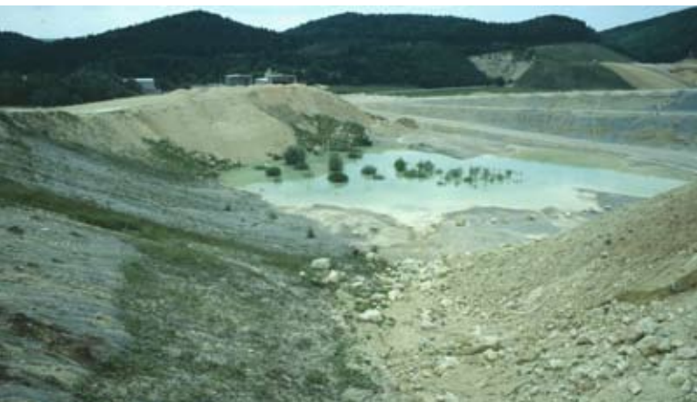
Abb. 8: Temporäres Gewässer - aufgenommen 1992.