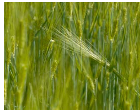
Abb. 51: So entstehen ertragreiche neue Ackerflächen.