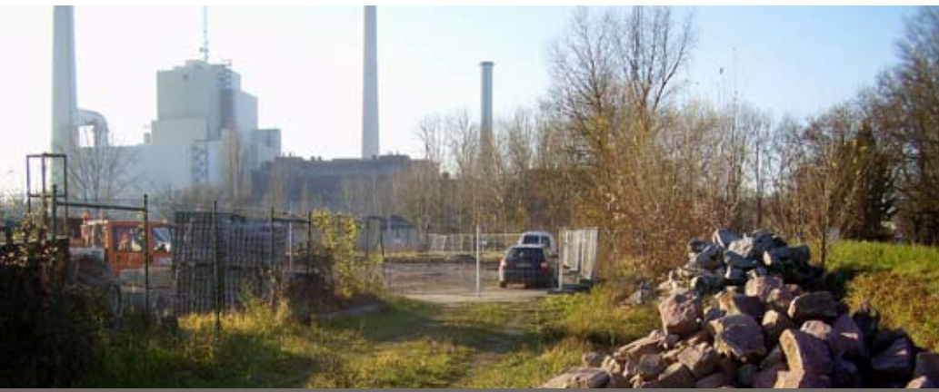
Abb. 83: Ein Lagerplatz für Steine gibt gleichzeitig gefährdeten Wildbienen und Heuschrecken Lebensraum.