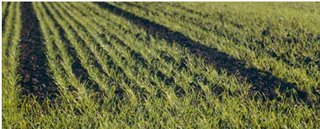
Abb. 48: Aufgehende Getreidesaat.