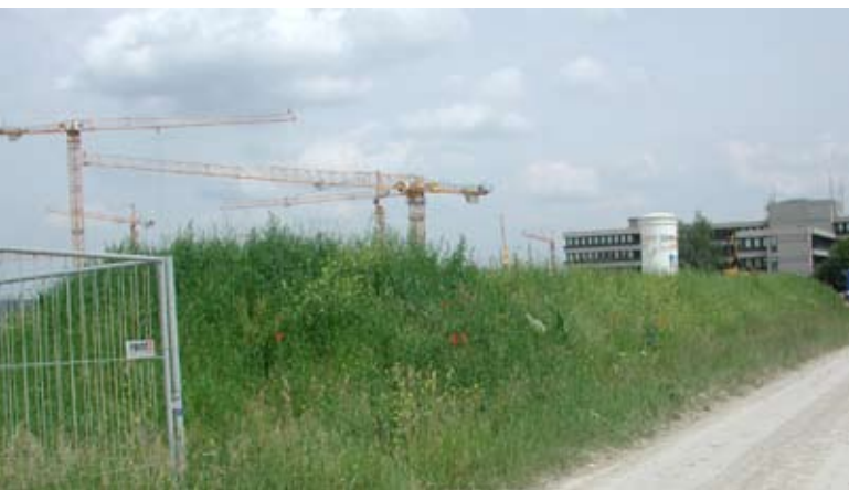
Abb. 22: Selbstbegrünte Miete etwa 6 Monate nach der Schüttung.