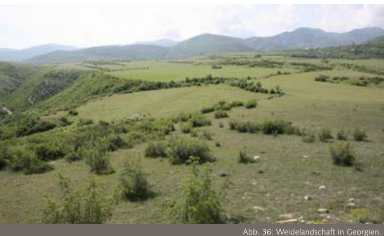
Abb. 36: Weidelandschaft in Georgien.

können auch erfolgreich punktuell als Sichtschutz oder zur Personenlenkung eingesetzt werden.