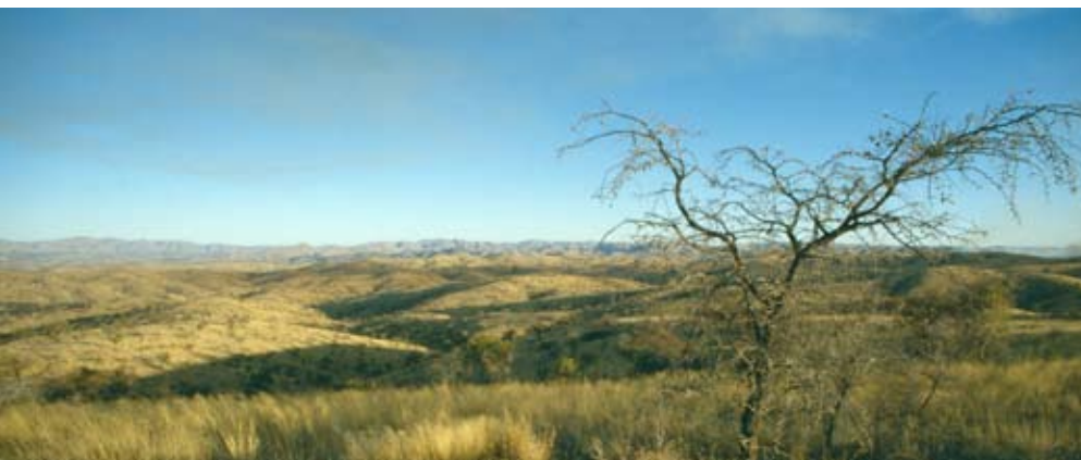
Abb. 38: Afrikanische Savannenlandschaft im Hochland von Namibia.

Wasser und Wärmemangel fördern offene Grasfluren ebenso wie Überschwemmungen. Wildtierherden drängen Gehölze zurück. Magere, flachgründige Böden oder regelmäßige Brände geben Gräsern einen Vorteil vor den nicht so trockenheitsresistenten Gehölzen (Abb. 39).