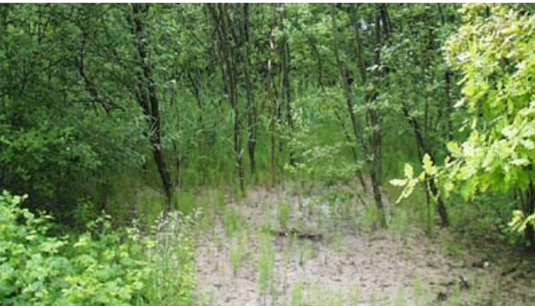
Abb. 10: Besiedlung eines Absetzbeckens.