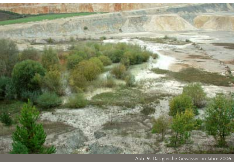
Abb. 9: Das gleiche Gewässer im Jahre 2006.

viele Pflanzenarten, die sehr schnell besiedelt werden (vgl. Abb. 9, Abb. 10), während trockene oder wechsellückige, tonige Lebensräume aufgrund ihrer extremen Standortbedingungen längere Zeit bis zu einer relevanten Besiedlung benötigen (Abb.11, Abb. 12).