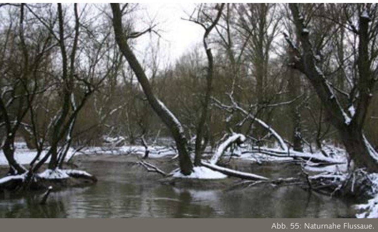
Abb. 55: Naturnahe Flusssaue.