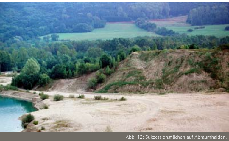
Abb. 12: Sukzessionsflächen auf Abraumhalden.