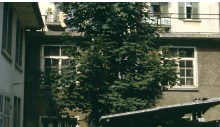
Abb. 81: Spontanes Grün im Hinterhof.