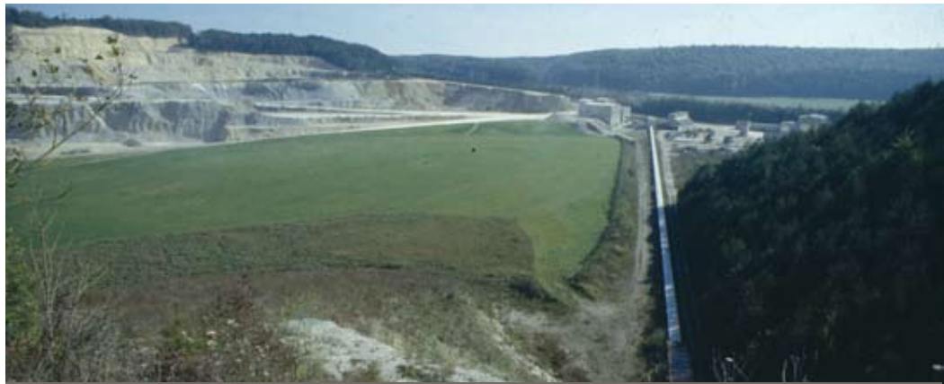
Abb. 44: Großflächige Wiesenrekultivierung in einer betriebenen Abbaustätte.