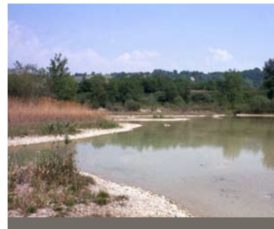
Abb. 60 (links und rechts): Seen in Nassbaggerungen.