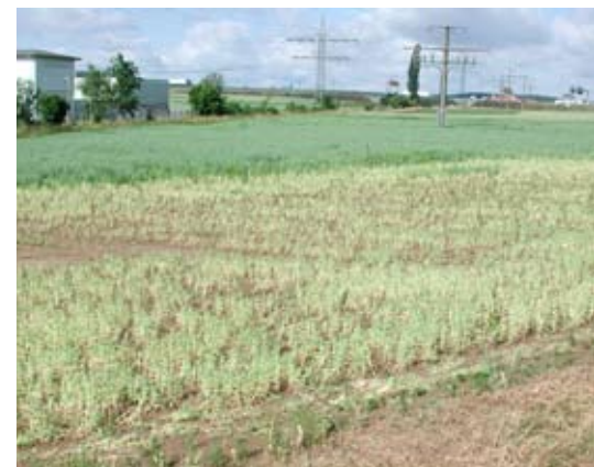
Abb. 14: Verdichteter Boden führt zu schlechter Ernte.

Boden ist der oberste, unversiegelte, belebte Grenzbereich der Erdoberfläche. Er besteht aus dem gut durchwurzelten humosen Oberboden (bis etwa 0,5 m mächtig) und dem verwitterten, nicht stark durchwurzelten Unterboden (meist 0,3-2 m mächtig) und ist ein Umwandlungsprodukt aus Gesteinen, abgestorbenen Pflanzen und Tieren, Wasser und Luft. Boden ist Standort für Pilze, Algen und Pflanzen und daher Lebensgrundlage für Tier und Mensch.