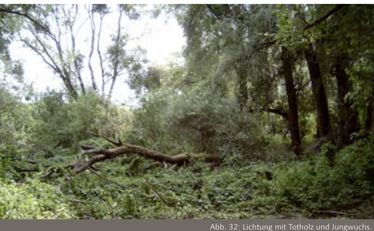
Abb. 32: Lichtung mit Totholz und Jungwuchs.