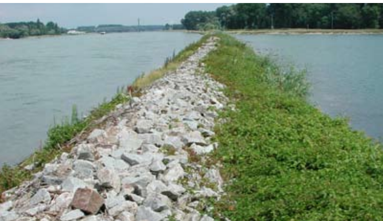
Abb. 52: Große Flusssysteme gestalten die Landschaft – und wurden selbst vom Menschen gestaltet.