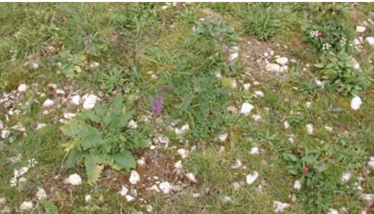
Abb. 45: Wiesenansaat durch Mähgutausbringung auf flachründigen Böden.